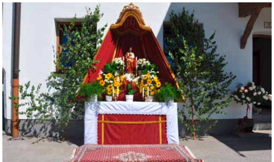
Prozessionsaltar beim „Tenigler“ (Fam. Oss/Götzl)