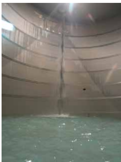
Der Hochbehälter wurde gereinigt und nach der Wiederbefüllung desinfiziert.

Infolge der besonderen Gegebenheiten in Tirol kann ein großer Teil der Bevölkerung direkt mit nativem Quellwasser versorgt werden. Durch die hohe Lage der Quellen sind die Wässer zumeist nicht