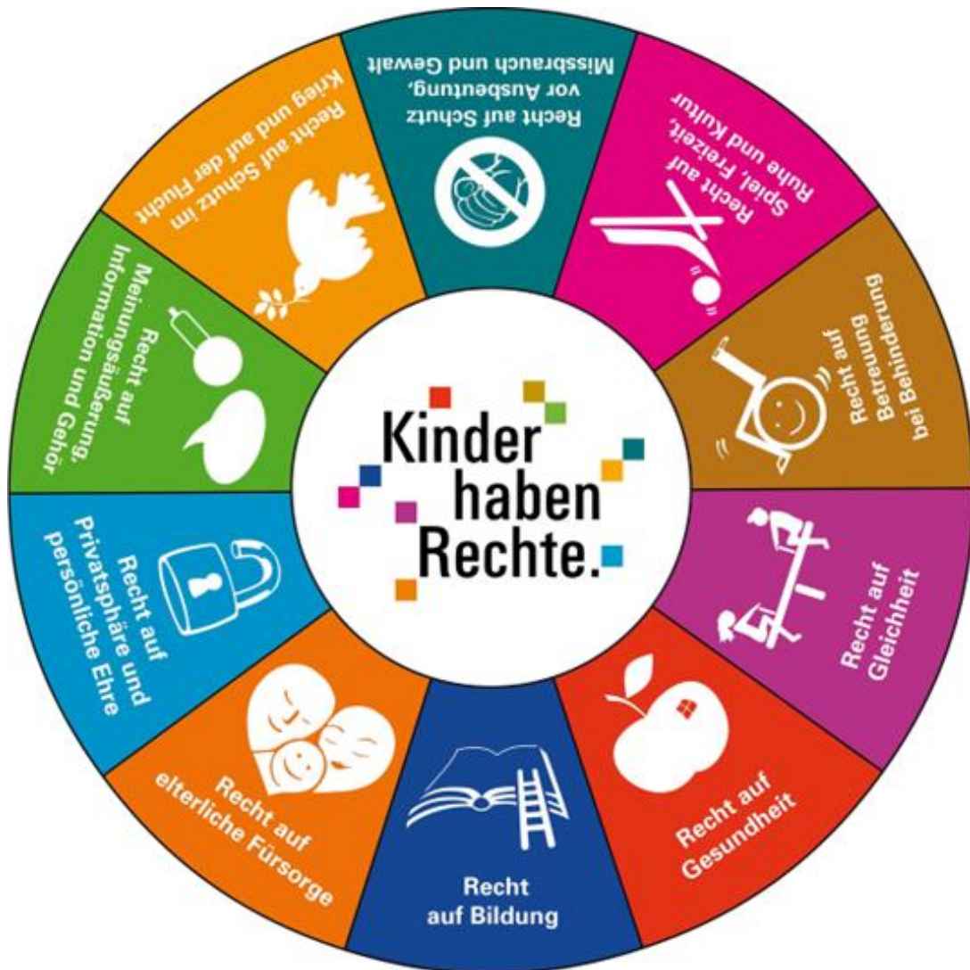
Abbildung 1: Kinder haben Rechte