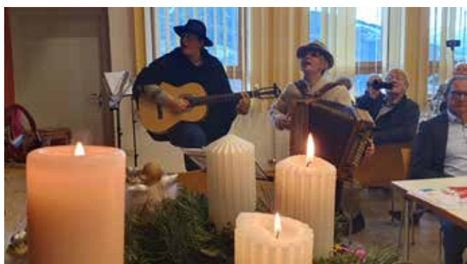
Weihnachtlich geschmückter Gemeindesaal

Wir bedanken uns an dieser Stelle auch bei der Gemeinde Patsch, die die gesamten Kosten für die gelungene Feier getragen hat. An alle dafür ein herzliches „Vergelts Gott“.