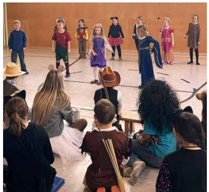
Modenschau am Fasching Dienstag