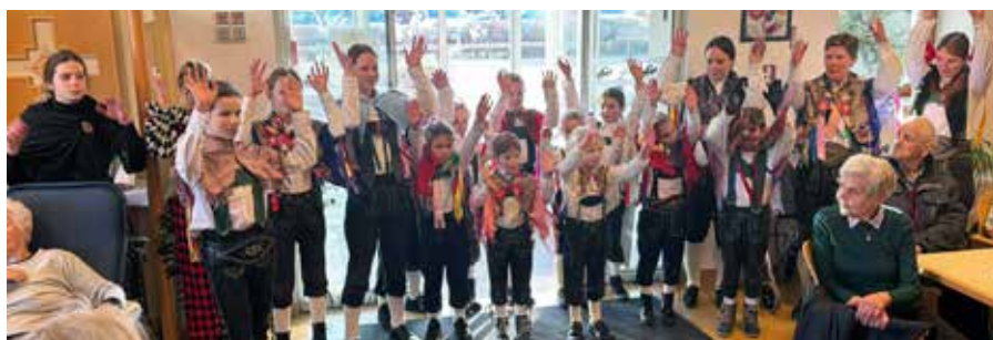
Besuch im Heim St. Martin