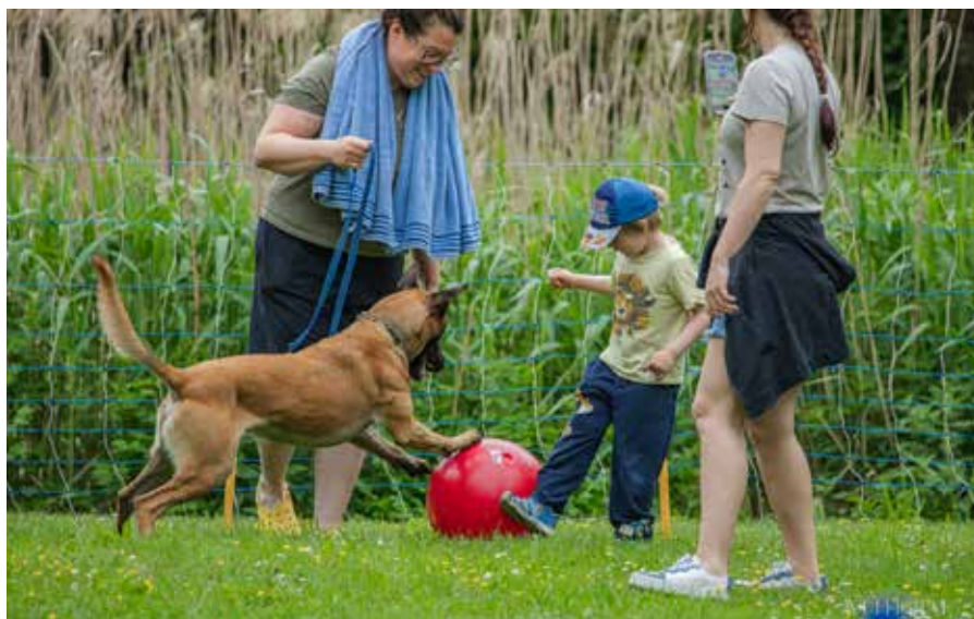
Action für den Vierbeiner, Groß und Klein.

Kommt vorbei und erlebt Hundesport einmal ganz anders – wir freuen uns auf euch! Nähere Infos unter www.trv1934.info .