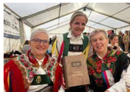
Das neue Unsinnigen-Buch