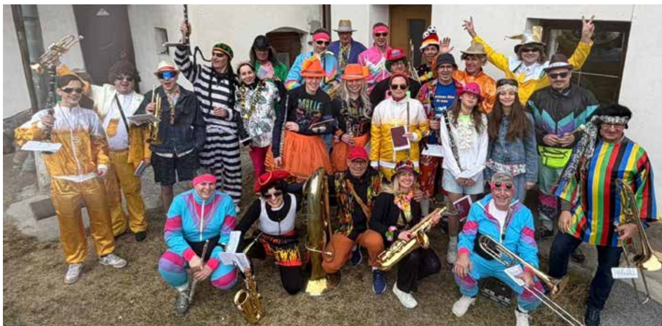
Musikalisch und stylish top am Unsinnigen