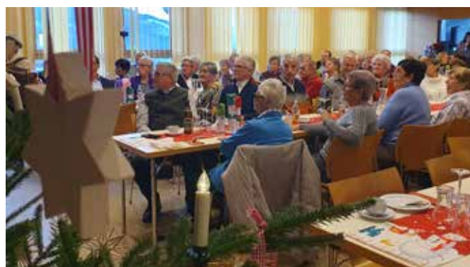
Viele unserer Senior:innen genossen die stimmungsvolle Feier