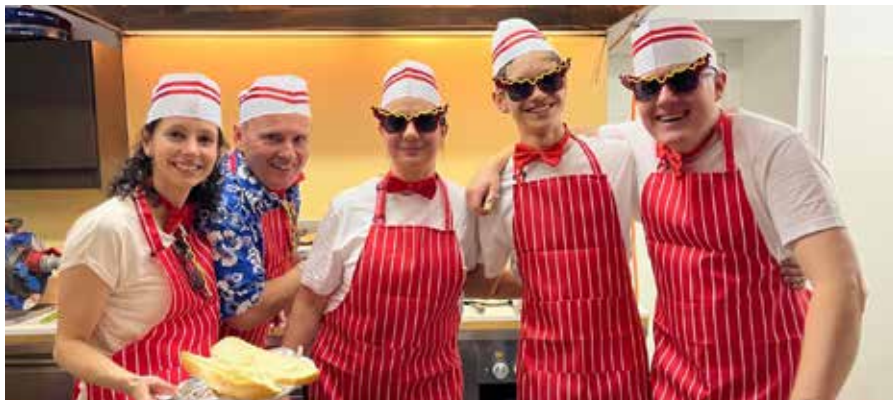
Küchenteam ist bereit