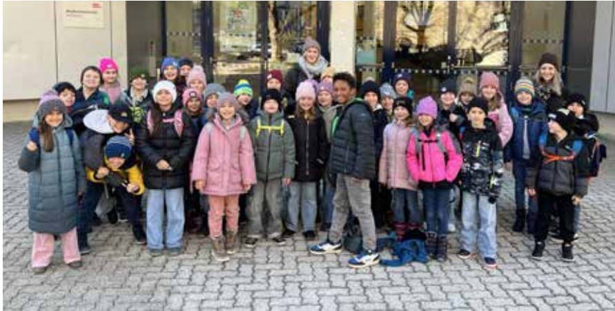
Toller Ausflug zum Musical „Das geheime Leben der Piraten“

Im Dezember fand im Rahmen des Adventfensters unser stimmungsvoller Patscher Adventmarkt statt. Bereits am Vormittag waren die Kinder mit großer Begeisterung in der Küche tätig. Mit viel Einsatz wurde gebacken, gekocht und liebevoll vorbereitet. Der herrliche Duft von Keksen und frischem Gebäck erfüllte das ganze Schulhaus. Am Markt wurden Punsch, Pizzaschnecken, Blätterteigbäume, Popcorn, Waffeln, Zimtschnecken und viele weitere Leckereien angeboten. Für jeden Geschmack war etwas dabei und die Besucherinnen und Besucher ließen