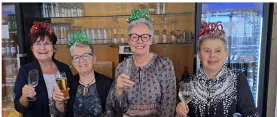
Ohne unser Creativ Team geht gar nichts

Auch wieder ein großes Danke an unsere Helferinnen.