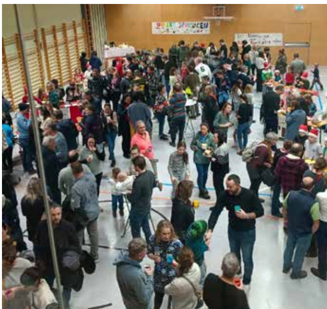
Adventmarkt in der Volksschule