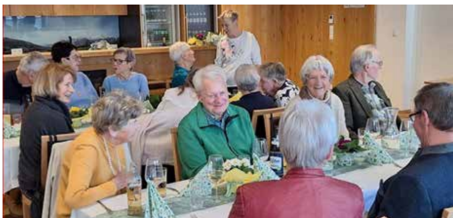
Schön dass es diese gemeinsame Feier für unsere Jubilare gibt