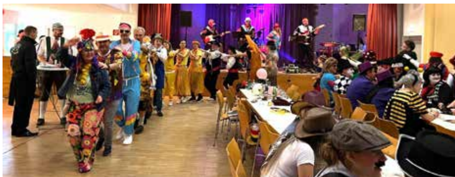
Beste Stimmung am Maskenball mit den Chiccos